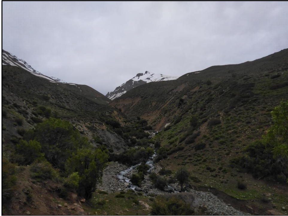
Quebrada del estero San Nicolás.

Lo que yo no sabía y me conversó mi cordada, es que había ciertas confusiones con la cumbre de la montaña, provenientes de la ubicación que dan las cada vez más numerosas aplicaciones de celular, la publicación de la otrora buenísima web de Andeshandbook -que ahora sigue y sigue acumulando descripciones con pifias- y también, porque no decirlo, porque las personas no investigan un poco más las cosas, y se guían básicamente por lo que encuentran en internet. Es justo mencionar que, a pesar de ser un cerro cercano y sencillo, poca información hay del Mesoncito, como para tratar de complementar los datos aportados por webs y aplicaciones, que en este caso particular eran incorrectos. Voy a aprovechar las prerrogativas que me da escribir este latero y muy aburrido relato, para al final, tratar de explicar -según mi humilde y poco experimentado punto de vista- lo que pienso de la confusión cumbre y como lo resolví yo.