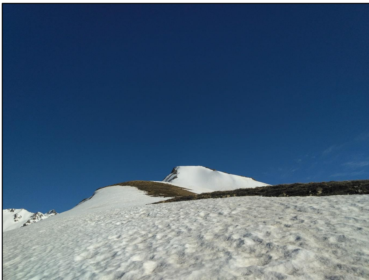
La P-3166; cumbre sur de El Mesón o Mesoncito.

Llegué a un punto donde se terminaba el terreno seco y la pendiente aumentaba, aquí paré a ponerme bloqueador, comer algo y ajustarme los crampones otra vez, la Vale iba más adelante, y como era ella la que tenía claro el rollo de las cumbres había rodeado la pirámide final, que no era tan final, por la derecha. Yo más pajarón y distraído, sin entender aun todo el tema de la confusión cumbre, comencé a subir derecho, y poco antes de llegar arriba, salí a la arista de la derecha por donde siguiendo un hermoso recorrido llegué a la primera punta, la P-3166 IGM (3.168 altímetro) que al parecer es la que históricamente se ha considerado cumbre, la que desde abajo parece la cumbre más lógica, y donde termina la ruta descrita en Andeshandbook. Hasta una pirquita de piedras había.