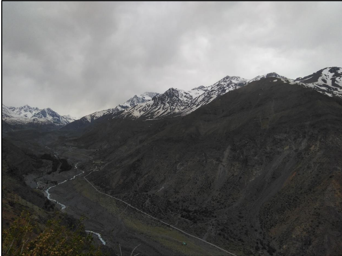
Postales durante la aproximación.

Así que en marzo por primera vez partimos rumbo al Mesoncito. La alegría duró poco, estando en el sector nos enteramos que el puente se lo había llevado el río, intentamos buscar alguna pasada, pero el Yeso es un río de aquellos con los que no se juega. Al final, en una salida con menos onda que electrocardiograma de muerto, nos devolvimos y a la cresta todo.